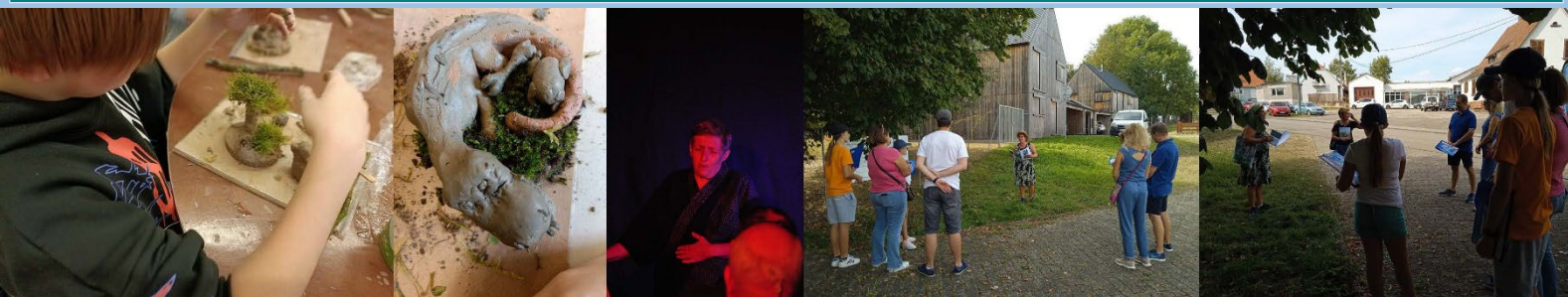
Des ateliers de modelage, une épopée contée et chantée, une animation « lecture déambulée »...