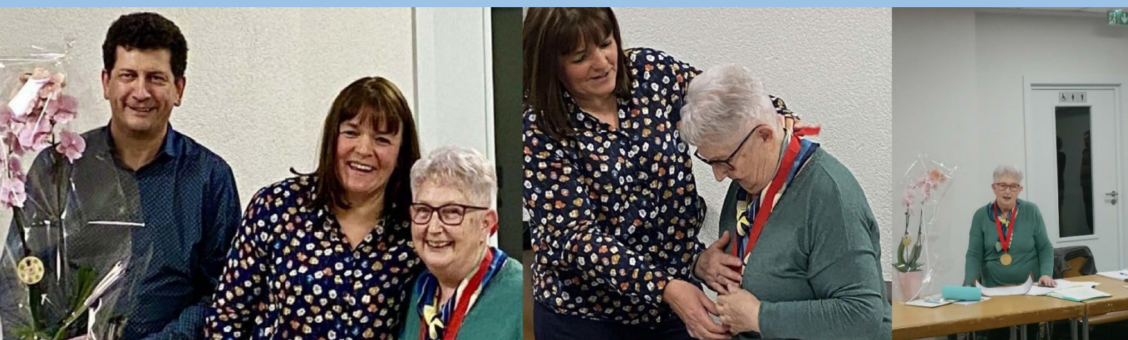
Une ancienne présidente très engagée !

Toutes les bonnes volontés pour des coups de main variés, réguliers ou occasionnels, sont les bienvenues, rejoignez-nous ! Faites vivre ce patrimoine qui contribue à la renommée de tout un territoire et ramène un nombre non négligeable de touristes qui sont aussi des clients de nos restaurants et commerces locaux !