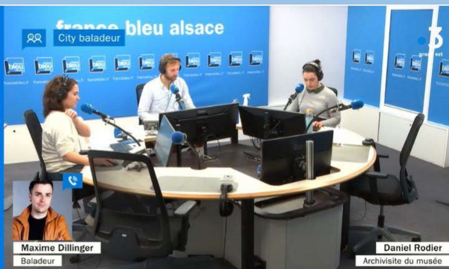
Visite du musée du pétrole

La vie d'un musée passe également par sa promotion. De nombreux contacts sont tissés au cours de la saison et le musée se fait connaître par de nombreuses insertions presse et touristique (Office de Tourisme de l'Alsace Verte, Office de Tourisme de Strasbourg...). Mais la renommée du musée se fait aussi à travers les relations journalistiques telles que des interviews sur France Bleu Alsace par exemple ou le tournage d'un reportage ARD-SR pour l'émission « Tour de Kultur-Grenzenlos ».