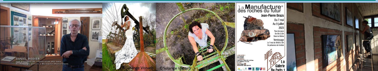
1 capsule vidéo « FEMS », 1 shooting photo, des expos artistiques à la Galerie du Puits 1...