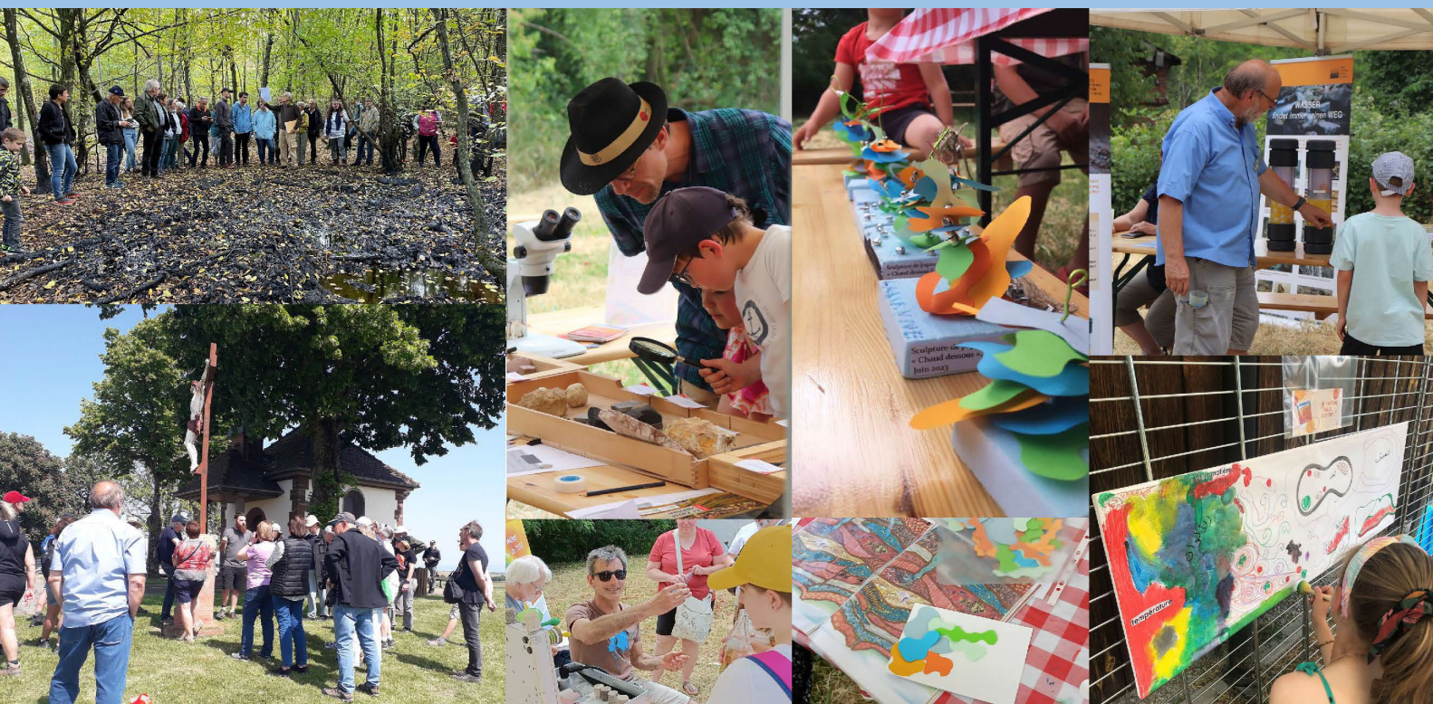
Des sorties et rencontres géologiques, un festival Alsascience...