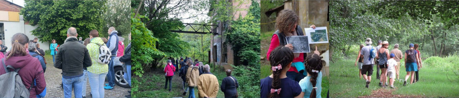
Des sorties à thèmes historiques...