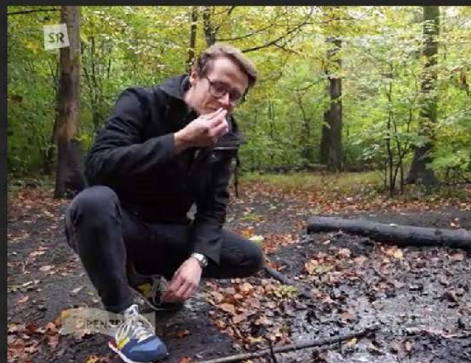
Des interviews journalistiques