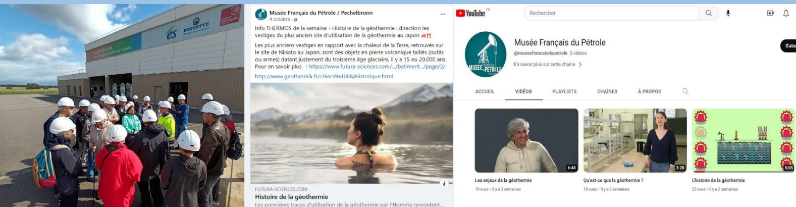
Une année dédiée : 3 vidéos pédagogiques, des visites d'une centrale géothermique, des post...