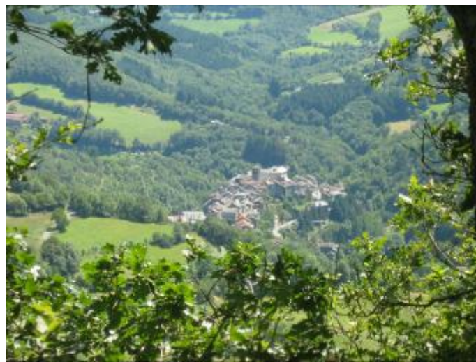
St-Sernin-sur-Rance, vu de la crête du Roucan (photo JCS, juillet 2007).