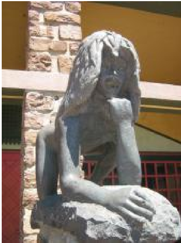
Victor, sculpté dans le basalte par Rémi Coudrain en 1987 pour la ville de St-Sernin-sur-Rance, dont il orne la place centrale.